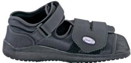
Darco®-Schuh für 4 Wochen nach der Operation

Sie dürfen ab dem ersten Tag unter Anleitung aufstehen. In den ersten 10 Tagen sollten sie aber eine gewissen Ruhe einhalten, auch zu Hause. Sie bekommen einen Spezialschuh für min. 4 Wochen. Danach braucht es einen bequemen kräftigen Schuh. Ihre Gehleistung sollte nach dem Abheilen der Knochen wieder vollständig hergestellt sein.